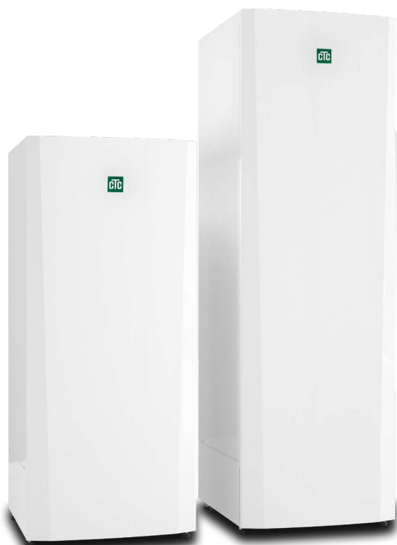
CTC Brilliant 200/ 300