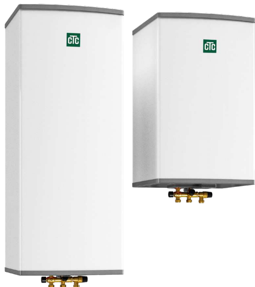
CTC Brilliant 60/ 110

Kombinationsventil KLK 15, vægkonsol og manual.